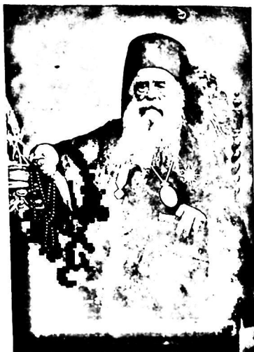
Εικ. 1. Καλλίνικος Καστόρχης, αρχιεπίσκοπος Φθιώτιδος († 1877).