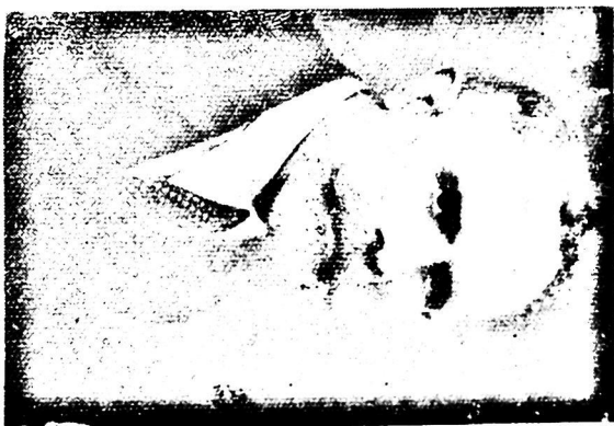
Εικ. 2. Γεώργιος ΙΙ. Παπουλάς, Μ. Εβσπρίτις τής Δημιοκρατίας.