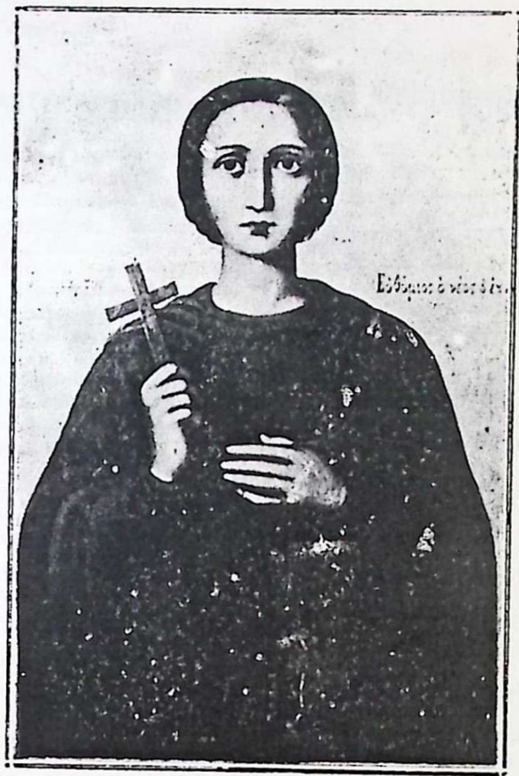
Ο ΕΚ ΔΗΜΗΤΣΑΝΗΣ ΝΕΟΜΑΡΤΥΣ ΑΓΙΟΣ ΕΥΘΥΜΙΟΣ